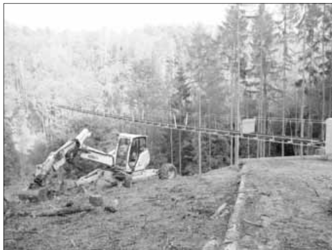
Die Brücke ist bereits klar zu erkennen