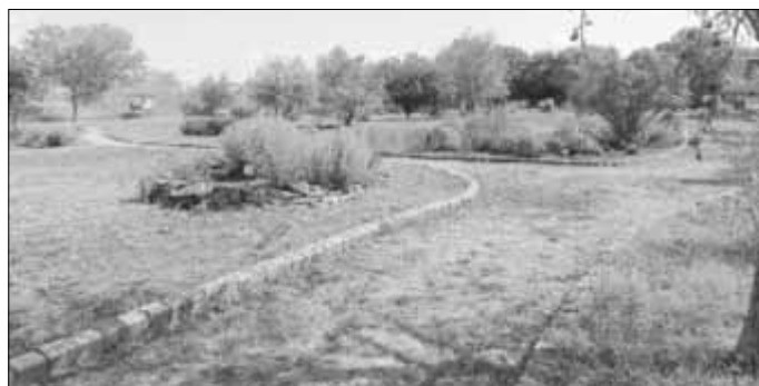
Jennifer Flock WIR für Artern e.V.

Auch in diesem Jahr haben wir uns unter anderem das Thema Spielplätze auf die Fahne geschrieben. Insbesondere sammeln wir für den Erhalt des Natur- und Kräutergartens. Wir möchten, dass dieser erhalten und aufgewertet wird. In dem offenen, großen Gelände gibt es große Wiesenflächen, Sträucher und Bäume sowie Kräuter. Der Natur- und Kräutergarten bietet gute Voraussetzung für Entspannen, Verweilen, Lernen und auch Toben in einem naturbelassenen Gelände. Wir möchten mit unserem Naturprojekt auf die vorhandenen Dinge aufsatteln und in Zusammenarbeit mit der Stadt Artern sowie den kleinen und großen Arterner Bürgern den Natur- und Kräutergarten wiederherichten. Hierzu sind wir bei www.betterplace.org , einer Plattform für gemeinnützige Projekte, registriert, wo Sie Ihre Spende auch direkt für dieses Projekt abgeben können. Wir benötigen finanzielle Mittel für einen Wasseranschluss, Sitzmöglichkeiten sowie für Baum- und Strauchschnitte. Selbstverständlich freuen wir uns auch über gefüllte Spendengläser.