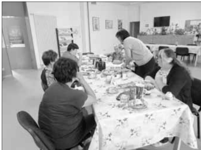
Frauenfrühstück am 21.08.2019