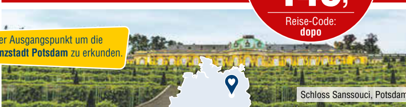
Schloss Sanssouci, Potsdam