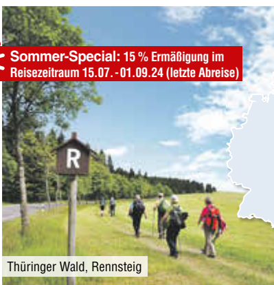
Thüringer Wald, Rennsteig