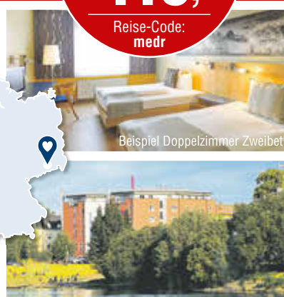
Beispiel Doppelzimmer Zweibett