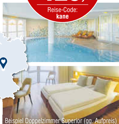
Beispiel Doppelzimmer Superior (gg. Aufpreis)