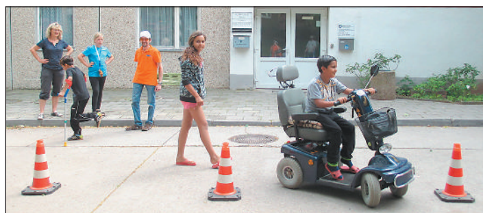
Das Elektromobil war gefragt