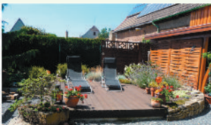
Zum Wohlfühlen braucht man nicht viel Platz.

Wünschen Sie sich einen Ort, an dem Sie ganz Sie selbst sein können, sich zu Hause fühlen – einen Ort mit Pflanzen, Holz, Stein und anderen Materialien?