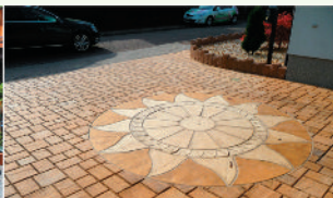
Die Sonne kann auch in der schattigsten Ecke scheinen.