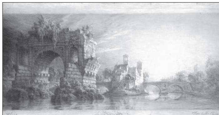
Rom III: Die Tiberinsel, 2002, Kaltnadel auf Stahl, 17,2 x 32,3 cm Privatsammlung