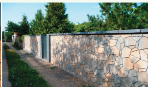
Es gibt Wege, die man als Mauer bauen kann.