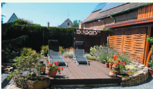
Zum Wohlfühlen braucht man nicht viel Platz.

Wünschen Sie sich einen Ort, an dem Sie ganz Sie selbst sein können, sich zu Hause fühlen – einen Ort mit Pflanzen, Holz, Stein und anderen Materialien?