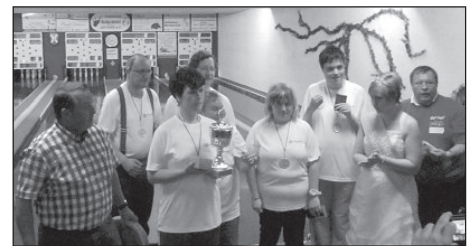
oben: Stolz konnte die 1. Mannschaft der Lebenshilfe Sömmerda den Wanderpokal der ersten Staffel mit nach Hause nehmen.

Stolz und glücklich zugleich nahmen die Sieger die Wanderpokale und die Platzierten