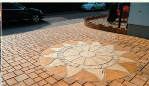
Die Sonne kann auch in der schattigsten Ecke scheinen.